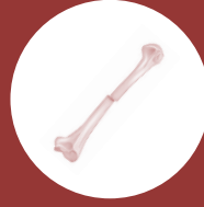
FRACTURAS ÓSEAS COLUMNA, CADERA CRÁNEO