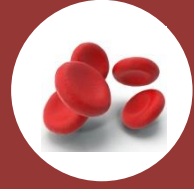
GLOBULOS ROJOS BAJOS