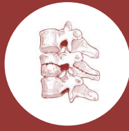
DOLORES ÓSEOS DOLOR EN ESPALDA